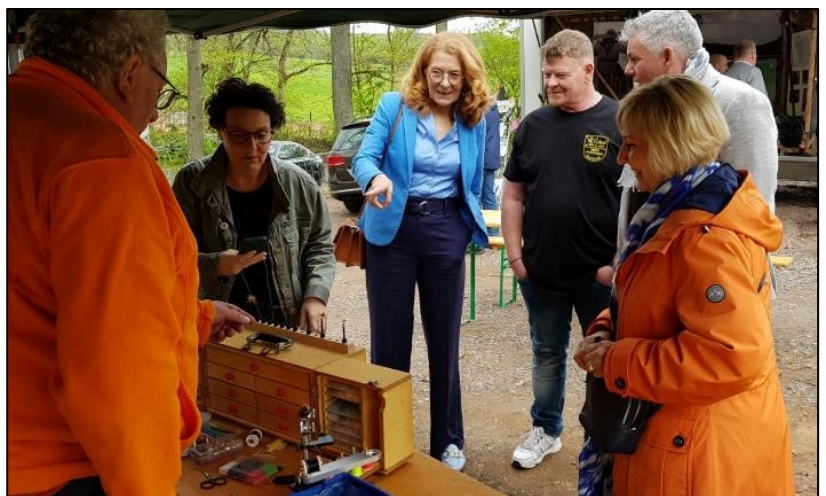
Bild 3: Die Ministerin Petra Berg beim Stand des Referats Fliegenfischen

Für alle Beteiligten des Fischereiverbandes Saar war es ein erfolgreicher Tag gewesen. Vielen Gästen des Frühlingsfestes konnten Informationen übermittelt und weitergeben werden. Und wer weiß, vielleicht sehen wir den ein oder Anderen bei einem der nächsten Veranstaltung wieder.